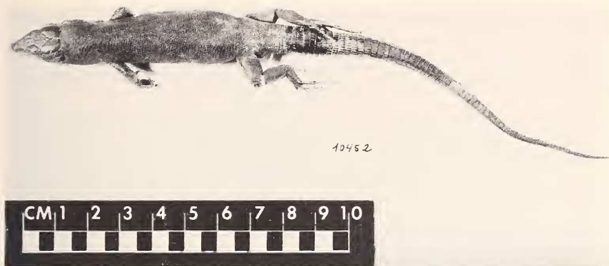
Fig. 12. AS 10452. Isla Na Pobra. Holotipo de Lacerta lilfordi pobrae .